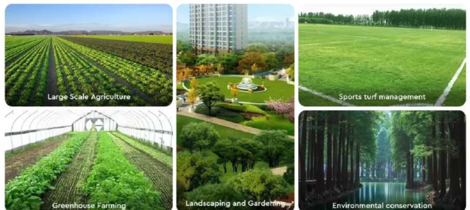
Benefits of installing LoRa soil moisture sensor

Los agricultores de hoy están desesperados por obtener datos que les permitan tomar decisiones precisas sobre el riego y la fertilización para optimizar el rendimiento de sus cultivos. Cuando todo lo demás sigue igual, la humedad del suelo es el factor principal que puede aumentar el rendimiento de los cultivos. Una vez que un agricultor puede controlar la humedad del suelo, puede maximizar los rendimientos de los cultivos a pesar de las limitaciones climáticas y de cultivos. El módulo LoRa de bajo consumo admite la recopilación de información del suelo, como la humedad y el pH, y transmite todos los datos a la puerta de enlace LoRa. Luego, la puerta de enlace lo envía a un servidor remoto o local para crear el entorno óptimo para el crecimiento de los cultivos.